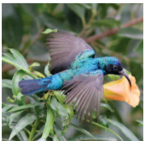
Lépnektármadár ( Cinnyris osea )

fényben csillog, hátoldala bronzoszöld, a feje teteje kékeszöld, torka és melle a réses fény szöge szerint acélkék-től bíborszínűig változik.