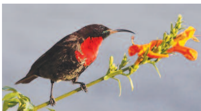
Vörösmellű nektármadár ( Chalcomitra senegalensis )

Szenegáltól Fokföldig a szavannákon és kertekben élő madár. A tollazata bársonyos barnásfekete, a szárnyain bronzos fény csillog. Homloka és álla élénk ércszöld színben szikrázik. A torokpajzsa valóságos ékítmény, a hasa felől nézve erőteljes kárminvörös, de ha derékszögből nézzük, akkor előtűnik finom harántcsíkossága, amely égszínkék színű, fényű.