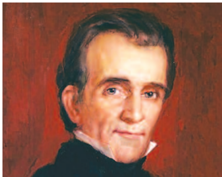
James Polk

Harmadszor is újra akarják temetni James Polkot, az Egyesült Államok 11. elnökét, amiért biztosan kijár majd neki „a legtöbb temetést kapott amerikai elnök” címe.