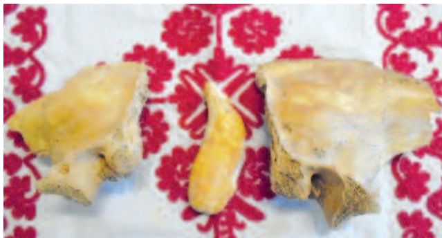
Barlangi medve csontok a sziget-hegységbeli Sárkány-lyuk barlangból

Bölcsek vagytok ti, szárnybontó rügyek, bölcsebbek, mint én, egészségesek ... Egy hónapja nem láttuk a napot, mégis hittetek és kibújtatok, hajtott a szent önzés, küzdöttetek, győzni akartatok és győztetek! (...)