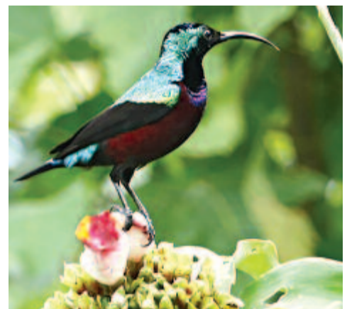
Kékmellű nektármadár ( Cinnyris superbus )

A 16 cm hosszú madár Nyugat-Afrikában él, erőteljes alkatú. A hasa mély sötétvörös; a tollazatának többi része élénk ércs