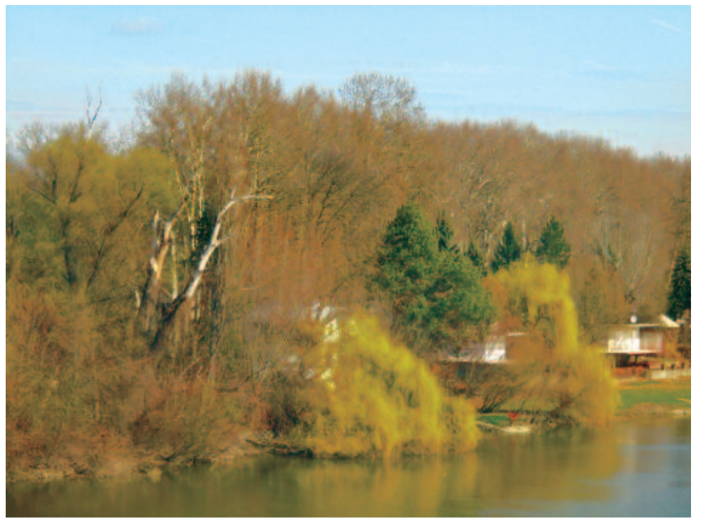
Ezer könnyű és friss fodrotok halványzöld lángként repdesi körül a gallyakat és táncol és örül

Győzedelmes április. Már az ókori görögök is egymás megtréfálásával köszöntötték a téltemető hónapot. Április bolondja az, akit április elsején rászédnek: a bolondját járatták vele. Több országban elterjedt szokás, eredete nem tisztázott. Egyik magyarázat szerint kelta népszokás volt, ilyenkor bohókás tavaszi ünnepeket ültek. Más magyarázat szerint IX. Károly francia király egyik rendeletéből ered: 1564-ben az új esztendő április 1-jéről január 1-jére tette. Az akkor szokásban lévő újévi ajándékozás megmaradt, de a rendelet után április elsején már csak bolondos ajándékot adtak egymásnak az emberek.