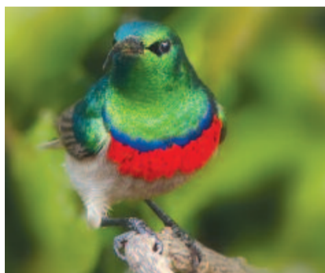
Kékszalagos nektármadár ( Cinnyris chalybeus )

A csőre hosszabb, mint a feje; mégis előfordul, hogy a virágokat a tövükön szúrja meg. Nemcsak a nektárt kedveli, hanem a rovarokat is. Ezeket a levegőben repülve fogja meg. Fészket a tojó építi magas fákra, a körte alakú építmény lefelé csüng a magasban feszülő ágról.